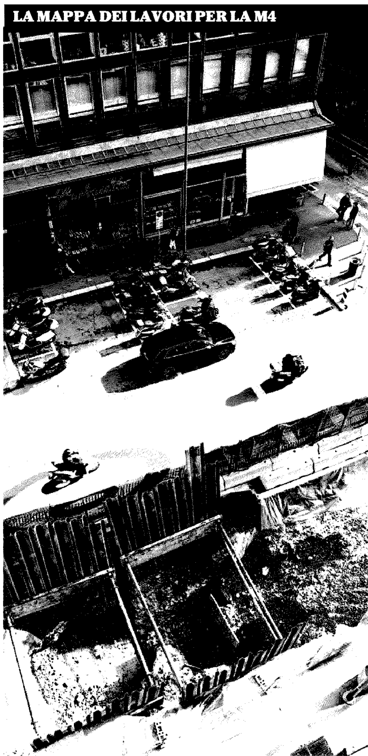
LA MAPPA DEI LAVORI PER LA M4