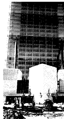
La stazione Tre Torri della linea 5, all'interno di Citylife, è pronta ma sono in ritardo i lavori per il grattacielo