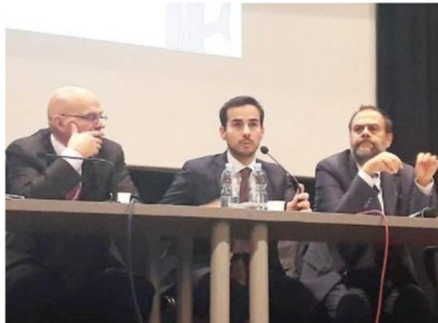
SUMMIT L'ultimo incontro pubblico al teatro di via Solari